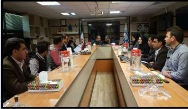
جلسات شورای بهورزی استان