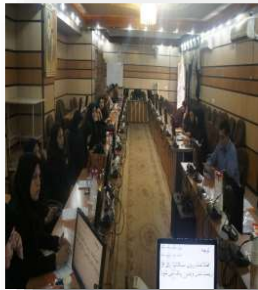
کارگاه توانمند سازی مربیان مراکز آموزش بهورزی مراقبت ادغام یافته ایدز، خدمات نوین سلامت، بهداشت محیط، سلامت باروری