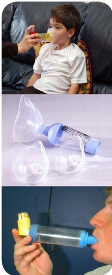
تصویر ۶: محفظه مخصوص