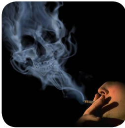
تصویر ۴: دودسیگار